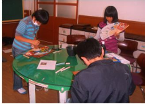
그림 3-14. 수업 활동