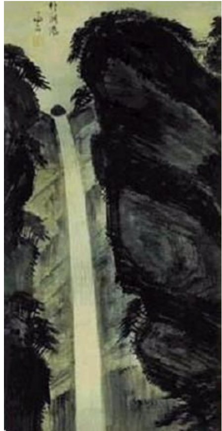
그림 3-7 박연폭포, 정선

정선 그림의 특징은 진경산수(實景山水)화라는 것이다. 진경산수란 화가가 직접 풍경을 대면하고 그려내는 실경산수와 비슷한 것이다. 하지만 정선의 그림이 실경산수(實景山水)와 다른 점은, 실제로 눈앞에 펼쳐지는 풍경에다가 작가의 감흥을 더하여 그려내는 것이다. 당시 화가들은 방안에 앉아 종이나 비단을 펼쳐 놓고 상상을 하면서 그림을 그려내었다. 반면에 정선은 산이나 강가 등 멋진 풍경을 직접 찾아가, 눈앞에 두고 붓을 들었다. 바로 이 점에 대해 많은 이들이 정선만의 독창성을 인정하고 있는 것이다. 서양으로 말하자면 화구를 들고 밖으로 나간 인상파 화가들의 스타일과 같다고 할 수 있다.