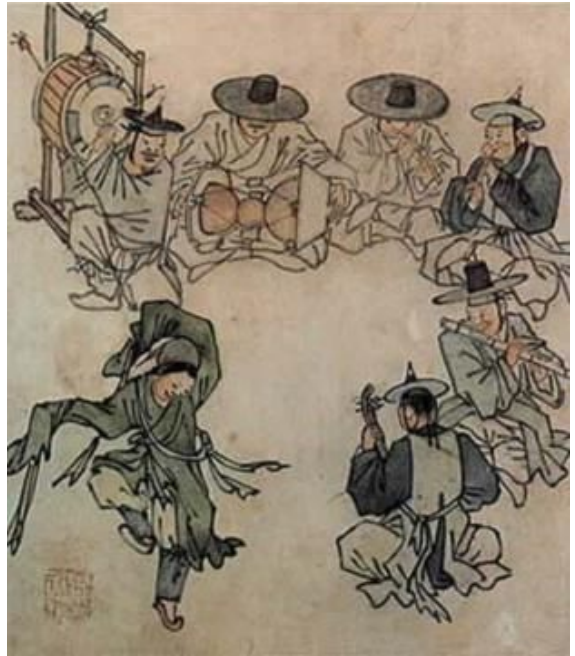
그림 3-9 무동, 김홍도

당시 천민으로 취급받던 대장장이·풍각쟁이, 마부나 머슴들의 생활에서 우리나라는 삶의 흥겨움을 이처럼 해학적으로 다룬 것은 당시로서는 파격적인 일이었다. 단원은 당시 신윤복(申潤福)과 함께 풍속화에 있어서 독보적인 경지를 개척한 화가로, 간결하면서도 섬세한 단원 특유의 필법을 구사하여, 《무동》 이외에 《서당도(書堂圖)》, 《씨름도》 등의 작품을 남겼다.