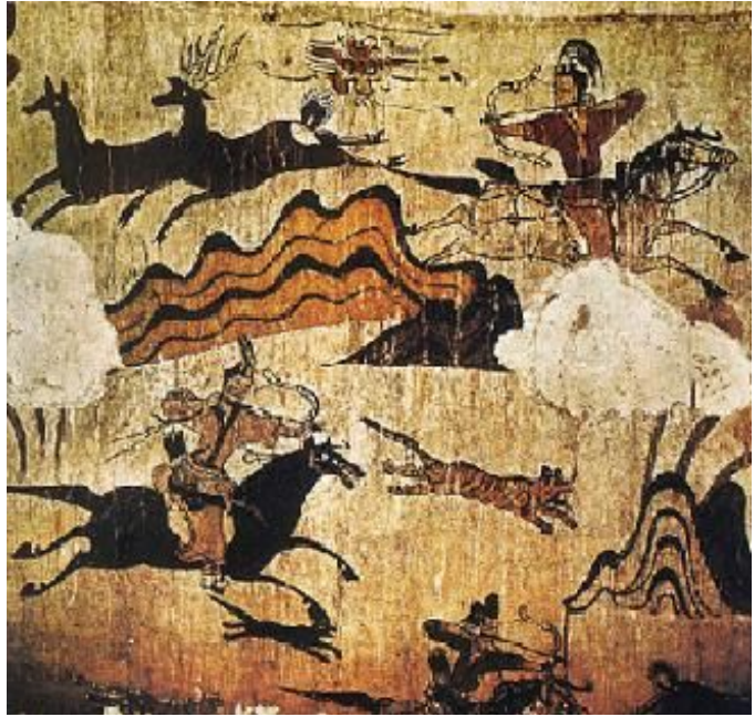
그림 3-1 무용총 수렵도, 4세기말~5세기 초

무용총 널방 서벽에 채색된 수렵도(狩獵圖)는 활달하고 힘찬 고구려인의 기상을 아낌없이 보여준다. 큰 나무를 사이에 두고 오른쪽에 소가 끄는 마차가 대기하고 있고 왼쪽에 사냥 장면이 전개된다. 사냥 장면