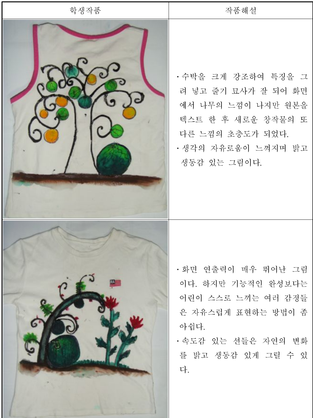
그림 3-6. 신사임당 초충도 작품을 패러디한 학생 작품