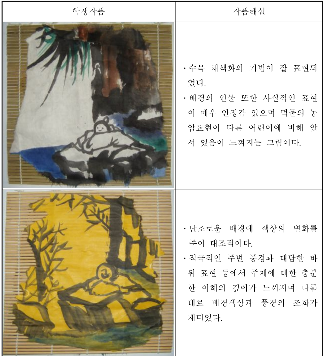
그림 3-4. 강희안의 고사관수도 작품을 패러디한 학생 작품