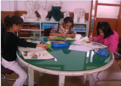
그림 3-15. 수업 활동