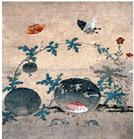
그림 3-5 초충도, 심사임당

심사임당의 <초충도> 종이는 낡았지만 섬세한 붓질은 아직도 곱게 살아있다. 특히 안정된구도와 밝은 색채가 눈에 띈다. 패랭이꽃, 맨드라미, 나팔꽃 등의 식물과 나비, 매미 등의 벌레를 소재로 하고 있다. 그 가운데 하나인 초충도는 안정된 삼각형구도