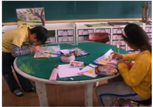
그림 3-16. 수업 활동