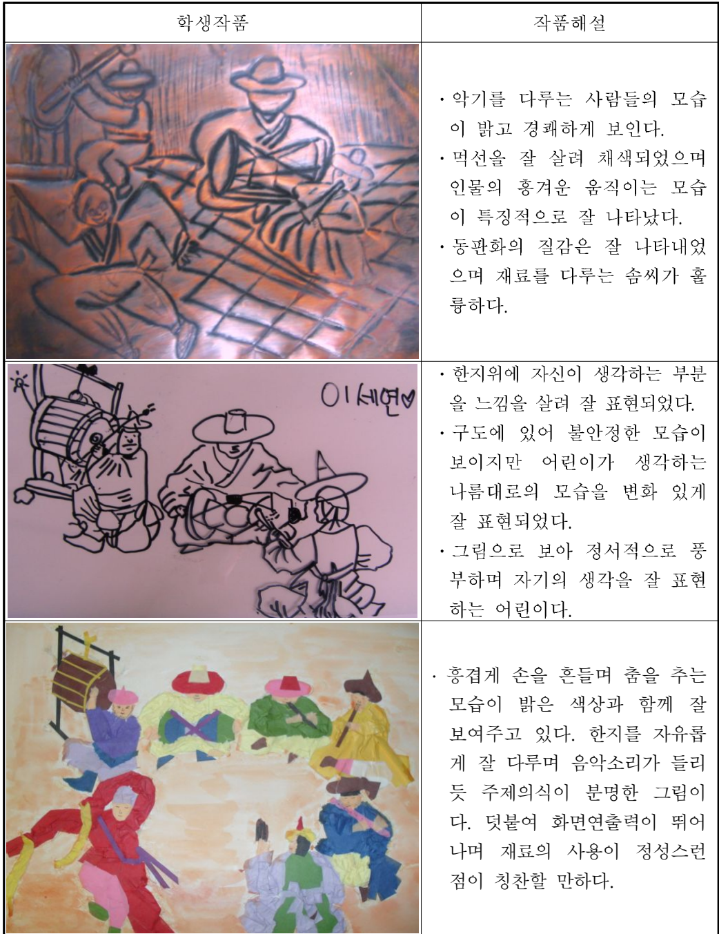
그림 3-10. 김홍도의 무동 작품을 패러디한 학생 작품