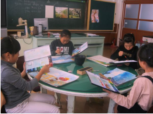
그림 3-13. 수업 활동