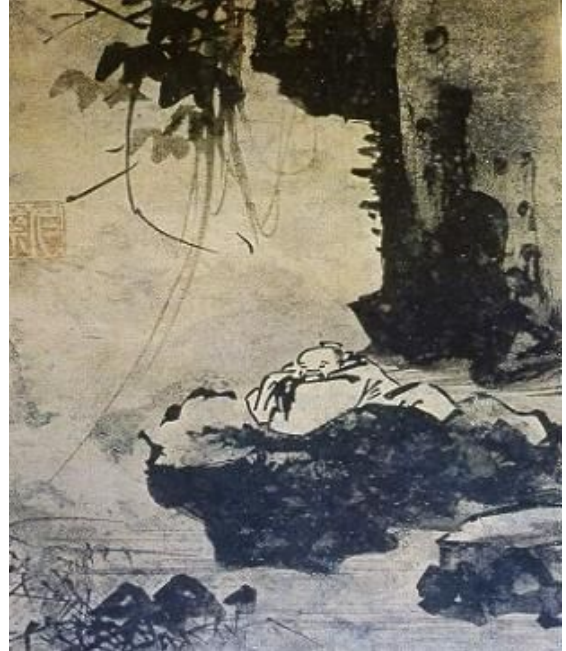
그림 3-3 고사관수도, 강희안

화재와 학문을 겸비했던 강희안의 고사관수도는 문인화의 대표적인 작품으로 학생들로 하여금 옛 화풍을 모사해보고 서로 기법을 터득하고 표현해보는 과정에서 수묵 채색화의 특징을 이해하고 감상하는 기회를 가져보는 것이 좋은 기회가 되었다. 더 나아가 수묵채색화(水墨彩色畫) 학습은 우리주위에 남아있는 문화유산에 대해 감상할 수 있는 안목을 기를 수 있는데 의의가 있으며 우리생활과 관련이 있는 발위에 화선지로 그림을 제작해봄으로써 우리생활에 다양한 예술문화가 존재함을 인식하는데 목적이 있다.