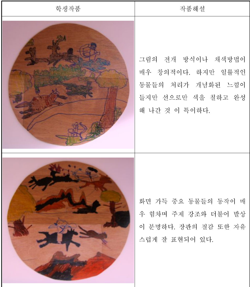
그림 3-2. 무용총 수렵도 작품을 패러디한 학생 작품