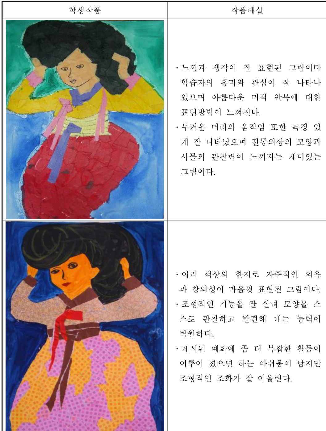
그림 3-12. 정종미의 종이부인 작품을 패러디한 학생 작품