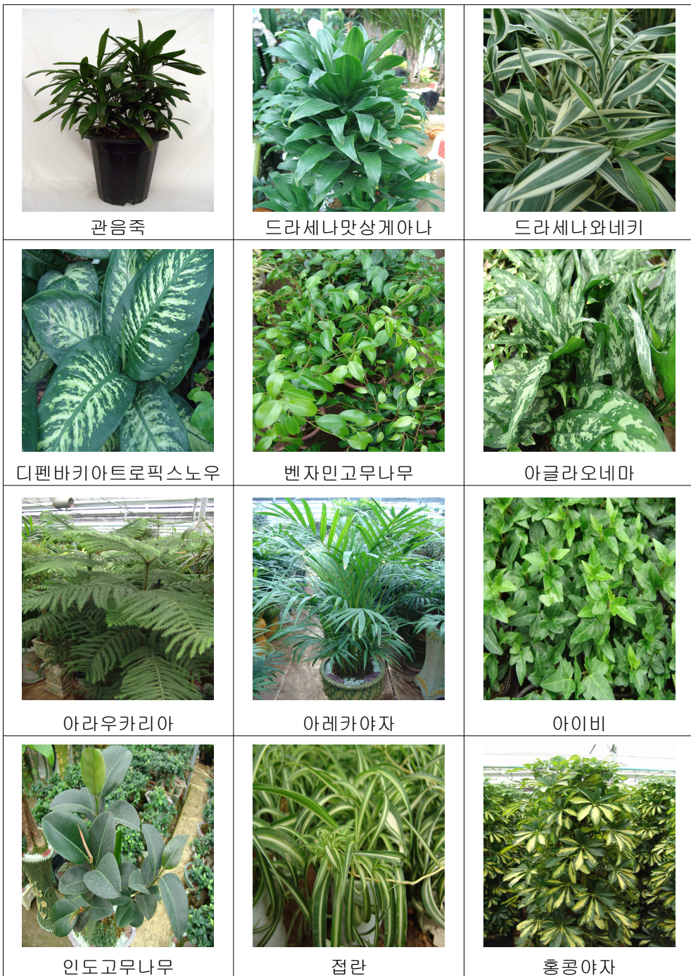
그림 2. 본 연구에 사용한 그린인테리어용 식물의 종류