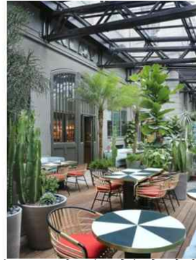
<그림 2-3 식물을 이용한 인테리어 >

나무는 식물로써 자연 친화적 요소 중 하나이다. 나무의 사용 및 기능은 재료로서의 사용, 구조로서의 사용, 자연 친화적 요소를 형상화 할 수 있는 모티브로써의 사용 할 수 있는 나무로 구분된다. 나무를 실내 공간에서 마감재의 재료로서 사용하여 나무가 가지고 있는 특성을 실내 공간에 표현 할 수 있다. 나무는 질감이나 나무의 무늬 및 나이트레를 활용하여 구조적인 역할에 사용 할 수 있다. 가공 하지 않고 자연 본연의 형태의 나무의 기둥을 사용하여 실내 디자인 요소로 적용되기도 하며, 건물 기둥으로써의 역할도 하기도 한다.