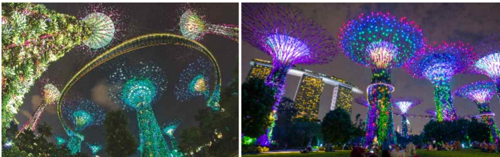
< 2-18 싱가포르 가든스 바이더 베이 '슈퍼트리' >

원형 변형적 표현 방법은 자연이 본래 가지고 있는 형태나 특성을 단순화하여 실내공간의 각 부분에 장식적으로 도입하여 타협적 성격이 강한 방법이라고 할 수 있다. 45)