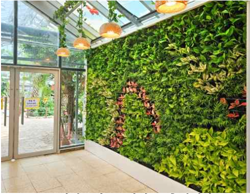
< 2-2-벽면녹화, 구리시 곤충생태관 >