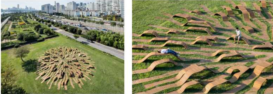
< 2-17 자연의 형상화-한강예술 공원 공공조형물 ‘뿌리벤치’>

따라 표현 할 수 있다. 추상(抽象)이라는 단어의 뜻은 ‘사물을 정확하게 이해하기 위해서 사물이 지니고 있는 여러 가지 측면 가운데서 특정한 측면만을 가려내어 포착하는 것이다’ 41) 이렇게 추상적 표현방법은 자연 요소의 특성을 분석하여 구성 요소 간을 재조합하여 자연의 구성 요소를 생략하거나 제거하여 작가의 재해석을 정리하여 표현하는 방법이다. 이 표현 방법은 창조적인 표현 방법으로 실내 공간에서 표현된다.