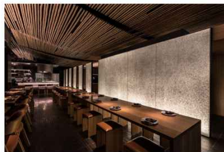
<그림 2-15 자연소재의 마감재(대나무,석재)>