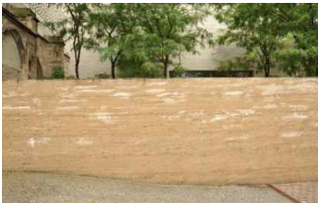
< 2-8 흙 다짐벽(콜롬바 미술관)>

흙은 자연에서 쉽게 구할 수 있는 요소로 사용 방법에 따라 다양하게 쓰인다. 실내 공간에서 실내 조경을 구성 할 때에 흙을 사용하여 자연 친화적 분위기의 공간을 연출하기도 하고, 실내 공간에서 흙으로 만든 재료인 벽돌이나 황토는 마감재로 주로 사용되고 있다. 실내 공간에 황토를 마감재로 사용하면 실내 공간의 질이 개선되어 친환경적인 효과를 낼 수 있는 특징이 있다. 또한 흙은 다양한 색과 질감을 이용하여 자연 친화적 감각을 느낄 수 있게 공간에 적용되기도 한다. 흙의 다양한 텍스처와 축조법으로 타 재료와 함께 벽에 부조 및 조각을 하여 추상적, 행동적, 기하학적, 상징적으로 예술적 창조와 융화되어 다양한 공간의 조형요소로 나타내기도 한다. 33)