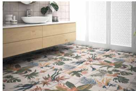
<그림 2-20 자연 모티브의 바닥 타일>