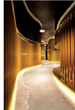
<그림 2-13 인테리어 조명 연출>