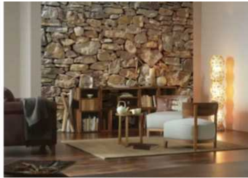
< 2-10 바닥재의 가공된 석재 >