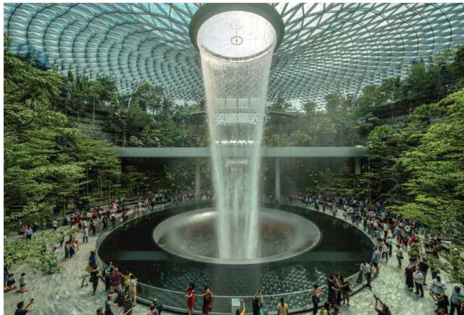
< 2-1 싱가포르 주얼 창이 공항(Jewel Changi Airport:구글이미지)>

자연친화적 디자인은 자연의 속성과 인간의 본성에 대한 환경 친화적이며 인간 친화적인 디자인을 지향한다. 그것은 자연에 새로운 질서를 부여하기 보다는 자연과 ‘평형(平衡)’을 중시함으로써 자연의 순환원리를 디자인에 적용하여 인간으로 하여금 자연과 조화롭고 자연의 물성을 통해 인간에게 쾌적하고 자연과 합일되는 환경을 제공하고자 한다. 25)