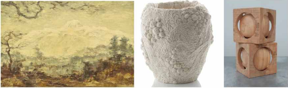
< 2-31 장식적 요소의 예술장식품 >

카페 공간에서 자연 친화적 요소를 표현 할 수 있는 요소 중 실내 조경이 있다. 실내 조경은 실내 공간에 생명력을 가진 각종 생물 또는 무생물 소재 등 자연에서 얻을 수 있는 소재를 중심으로 공간의 성격에 맞게 디자인이 전개된다. 자연친화적인 공간을 창조하여 보다 기능적이고 경제적이며 질 높은 생활을 영위할 수 있도록 하는 종합예술이다. 공간은 실내 조경으로 자연의 초록의 느낌과 맑은 물소리 등의 자연친화적 요소를 연출하여 삭막한 실내공간 속에서 볼 수 없는 자연의 분위기를 느낄 수 있다. 식물, 물, 돌 등의 자연적인 요소의 도입은 인간에게 심리적 안정감을 주고 습도 조절 등의 쾌적한 실내 환경을 유지하는데 큰 도움이 된다. 카페 공간에서 실내조경은 주로 화분을 통한 식물의 재배가 대부분이고, 공간을 분할하는 요소로도 많이 쓰인다.