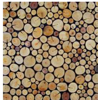
<그림 2-5 나무 단면의 패턴 마감재 >