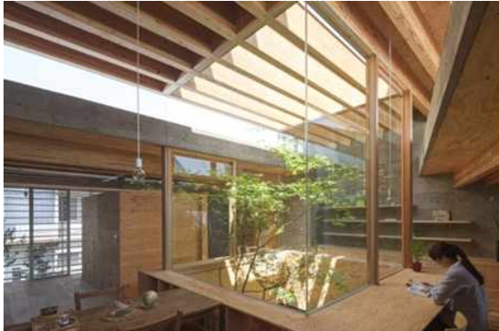
< 2-12 중정의 자연광 >

는 자연광을 도입해 쏟아지는 빛의 형태로의 도입이 가능하다. 인공광은 조명을 이용한 연출방법으로써 조명의 특색에 따라 다양한 공간 디자인 요소로 연출이 가능하다. 빛은 그 자체의 지각적 의미 이상의 그림자와의 결합, 반사각의 변화와 인공광과의 조화 등으로 공간 특성에 맞게 조형성과 상징성을 자연스럽게 연출하는 전통적인 공간 표현으로 다양한 감성 공간을 제시한다. 35)