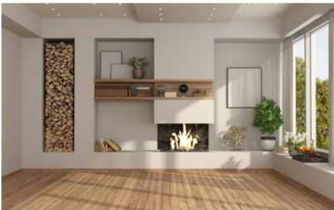
< 2-19 나무 재료의 바닥 마감재 >

구조적 요소는 내부공간을 한정하고 구획한 실내 공간 그 자체를 말한다. 실내 공간을 구성하고 있는 바닥, 벽, 천장과 공간에서의 움직임을 가능하게 하는 개구부(창문 등), 기둥 등의 요소이다. 이들 요소들이 조합되어 다양한 공간이 전개되며 공간에 있어서 성격을 부여하고 질적인 공간이 만들어진다. 이들 요소들은 자체 형태만으로 자연친화적인 표현의 특성을 직접적으로 나타내기도 한다. 46)