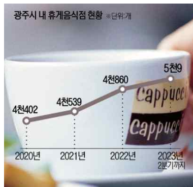
< 1-2> 코로나 바이러스 유행 이후 커피전문점 현황(광주광역시)

다섯째, 4장에서 지금까지의 이론적 고찰과 사례 분석을 바탕으로 자연친화적 요소가 적용된 카페 공간을 통해 실내 디자인에 대한 자연친화적 요소 적용의 중요성과 방향성에 대하여 종합적인 결론을 정리한다.