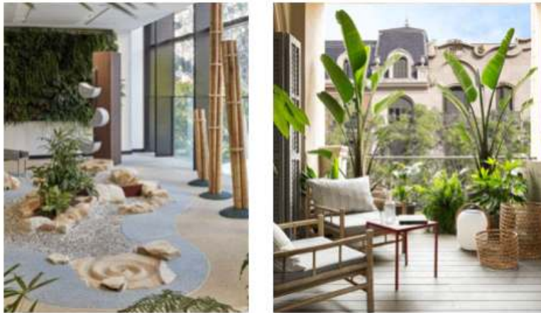
< 2-32 실내 조경과 플랜테리어 >

플랜테리어는 인간의 기본적인 욕구와 밀접한 관련을 가지고 주거 공간뿐만 아니라 카페, 오피스, 호텔 등의 상업공간에서 활용 범위가 확장되고 있다. 공간에서의 플랜테리어 활용 범위가 확장되면서 식물이 연출되는 스케일 또한 달라지고 있으며 플랜테리어는 소비자의 가치를 창출하는 포괄적인 의미도 포함한다. 자연적 요소의 활용은 단순한 연출 공간이 아닌 공간을 이용하는 사람들에게 다양한 감각을 제공하며 새로운 공간 가치 창출이 가능하다. 51)