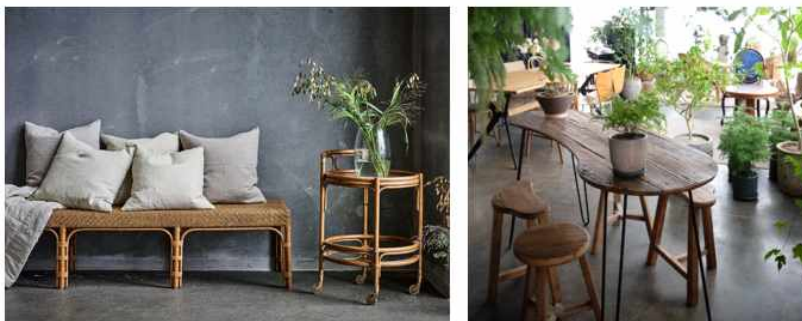
<그림 2-28 자연친화적 가구>

실내공간에서 가구는 인간과 건축물을 연결하는 요소의 하나로서 안락하고 능률적으로 행하게 하는 인간 생활행위의 수단으로 사용한다. 또한 가구는 수납의 기능을 가지며 실내 장식적 요소로도 작용하여 공간 연출에 있어서 미적 효과를 증대시켜준다. 실내 공간에 어떠한 종류의 가구를 연출하느냐에 따라 공간의 성격이 규정된다. 48)