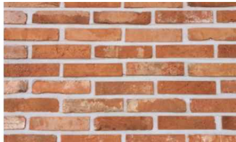
<그림 2-9 흙으로 만든 벽돌>

돌은 흙과 같이 자연에서 쉽게 볼 수 있는 요소이다. 석재의 특징으로는 구조적으로 강하며, 석재 특유의 질감과 색채가 다양하여 건물의 외장 및 구조, 마감재로도 사용되어 디자인 요소로 활용되고 있다.