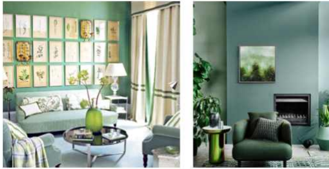
< 2-27 그린 인테리어-색채 >

색채를 이용한 공간디자인 방법 중 그린인테리어는 자연에서 흔히 볼 수 있는 색을 디자인 컨셉으로 하여 표현하는 방법으로 그린(초록색)을 이용한 디자인이다. 나무나 식물 또는 숲을 이루는 초록색 계열을 자연의 기본색이라고 간주하고 초록색을 디자인 요소로 많이 사용하여 전체적인 공간에 자연 요소가 없어도 자연적인 분위기를 연출할 수 있는 효과가 있다.