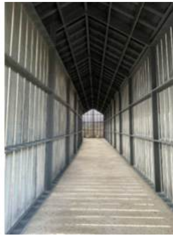
< 2-21 자연친화적 요소의 적용(벽)> <그림 2-22 수, 풍, 석 박물관 ‘바람’>

벽은 수직적 요소로 공간을 둘러싸 수평적 요소를 차단하여 공간을 형성하는 기능을 가지고 있고 벽면의 높이에 따라 공간의 수직적 범위를 시각적으로 나타낸다. 벽은 실내 공간을 구성하는 여러 요소들 중 가장 많은 면적을 차지하고 시각적으로 가장 먼저 지각되어 진다. 벽의 재료, 색채, 문양, 형태에 따라 실내 공간에서 분위기를 결정하는 가장 중요한 요소이다. 또한 실내에 놓이는 설치물인 가구, 조명 등이 설치되어지는 배경적요소이기도 하며 벽으로 공간의 형태를 명확히 하는 기능이 있어 윤곽적 요소이기도 하다.