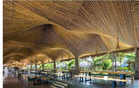
< 2-23 자연 형상화의 적용 천장 > <그림 2-24 자연 재료(대나무) 적용 천장>

천장은 바닥과 함께 공간을 형성하는 수평적 요소로 바닥과 천장 사이에 있는 공간을 내부공간이라고 규정한다. 천장은 시각적 흐름이 최종적으로 멈추는 곳으로 시각의 느낌에 영향을 미치며 내부 공간 어느 요소보다 조형적으로 자유로운 요소이다. 천장의 높이를 낮추면 아늑한 공간이 연출되고 높이면 시각적으로 확대감을 줄 수 있어 천장은 높이 조절만으로도 전혀 다른 느낌을 줄 수 있다. 또한 천장은 다양한 형태, 패턴, 장식으로 디자인의 다양한 이미지를 표현할 수 있는 요소로 공간의 변화를 풍부하게 나타낼 수 있는 요소이다.