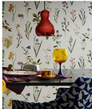
< 2-16 자연 모티브의 인테리어 필름지&벽지 엘지하우시스 >

이 표현 방법은 직접적으로 공간에 적용하는 것이 아니라 자연의 형태를 단순화하거나 모티브로 삼아 변형하는 방법으로 이는 실내공간에서 장식적인 요소로 사용되고 있다. 물, 빛, 흙과 나무와 같은 생태요소의 간접적으로 표현된다면 느껴지는 이미지의 바탕으로 자연적 감성을 나타 낼 수 있다. 이렇게 자연과 인간이 가지고 있는 의미와 표현을 공존 시켜 공간의 이미지를 풍부하고 복잡하게 만들으로써 자연 경관이 배경이 되거나 장식적 요소로 실내 공간에 적용 된다. 이는 실내 공간의 분위기를 더욱 드라마틱하게 연출하기도 한다. 40)