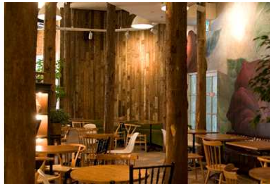
<그림 2-25 유기적 곡선의 기둥-구조적 > <그림 2-26 자연 분위기 연출의 기둥-상징적>

기둥은 공간을 형성하는 기본 틀 중의 하나로 크기, 형상을 가지고 있는 선형의 수직 요소이다. 벽체를 대신하여 구조적 요소로 사용되기도 하고 디자인에 따라 실내의 성격을 주고 강조 또는 상징적인 디자인 요소로도 사용된다.