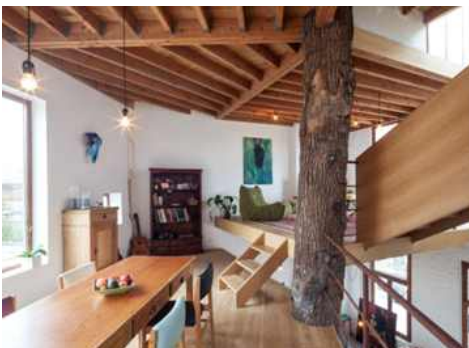
<그림 2-4 나무 기둥이 중심인집(벨기에)>

또한, 나무의 형상화는 실내 공간에서 장식적인 디자인요소로 사용된다. 인공적으로 구성된 정원은 나무 및 다양한 식재로 계절의 변화를 느낄 수 있는 감각적인 자극원이 된다. 또한 물, 빛, 흙 등의 다른 자연 친화적 요소와 함께 디자인되어 인공의 삭막한 환경의 분위기의 공간을 자연친화적 분위기로 환기를 시킬 수 있는 요소로 적용될 수 있다.