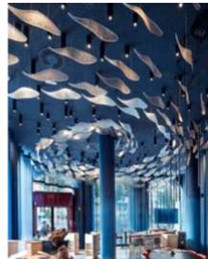
< 2-29 자연친화적 요소의 자연조명 >