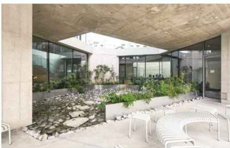
< 2-14 중정을 이용한 실내 정원 >

실내 공간의 장식적인 요소로 쓰일 때 자연친화적 요소를 사용하여 실내 공간에 시각적인 효과를 주어 자연 분위기를 연출한다. 자연친화적 요소의 직접적 표현 방법은 주로 실내공간의 장식적인 요소로 쓰이고 최근에는 구조적인 측면에서도 쓰이고 있다. 이를 적용하는 실내공간은 자연친화적 요소를 장식적 형태로 표현하기 위해서 온실이나 중정, 아트리움 등의 디자인 기법으로 표현한다. 39) 또는 소재적 측면으로 자연친화적 요소를 실내공간의 마감재에 사용하는 방법과 가공된 자연친화적 재료를 사용하여 실내 공간에 자연 분위기를 연출하는 방법이 있다. 실내 공간에서 자연친화적 요소의 재료를 적극적으로 사용하고, 자연친화적 요소의 특징적 패턴과 질감으로 다양하게 연출하여 자연의 느낌을 살린다. 이는 사람들이 실내 공간에서도 자연친화적 요소를 경험함으로써 자연 속에 있는 것처럼 느낄 수 있어 생명력을 가진 자연의 활기로 심리적 안정감과 감성적인 분위기를 창출한다. 이런 자연친화적 요소의 적용은 실내 공간을 보다 쾌적하고 편안한 환경으로 만들어 주는 역할을 한다.