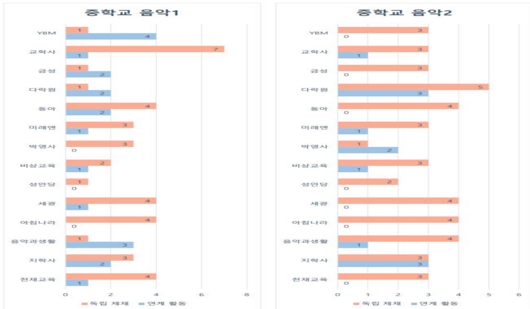
<표 11> 중학교 음악1,2 출판사별 독립 제재와 연계 활동의 빈도수

빈도수를 분석할 때에 ‘중학교 음악1’ 과 ‘중학교 음악2’ 는 유사한 패턴과 유형을 보이므로 통합적으로 분석하며, ‘고등학교 음악’ 은 별개로 분석하였다. 그리고 독립적인 제재를 가진 창작 활동은 ‘독립 제재’ 로, 다른 영역과 연계된 창작 활동은 ‘연계 활동’ 으로 표현하였으며, 학년별로 분류하여 각 출판사의 창작 활동 제시 방법을 비교 분석하였다. 다음은 중학교 음악1과 중학교 음악2의 출판사별로 ‘독립 제재’, ‘연계 활동’ 의 빈도수를 비교한 <표 11>와 고등학교 음악의 출판사별로 ‘독립 제재’, ‘연계 활동’ 의 빈도수를 비교한 <표 12>이다.