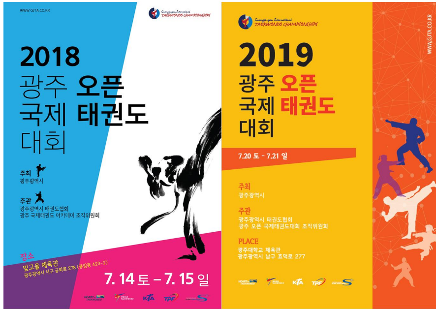
그림 6. 광주오픈국제태권도 대회 포스터

화한다. 마지막으로 태권도를 통해 활발한 국제 네트워크를 강화하여 참가 선수와 관계자들에게 기억할 수 있는 경험을 제공한다고 하였다(광주오픈국제태권도대회, 2021).