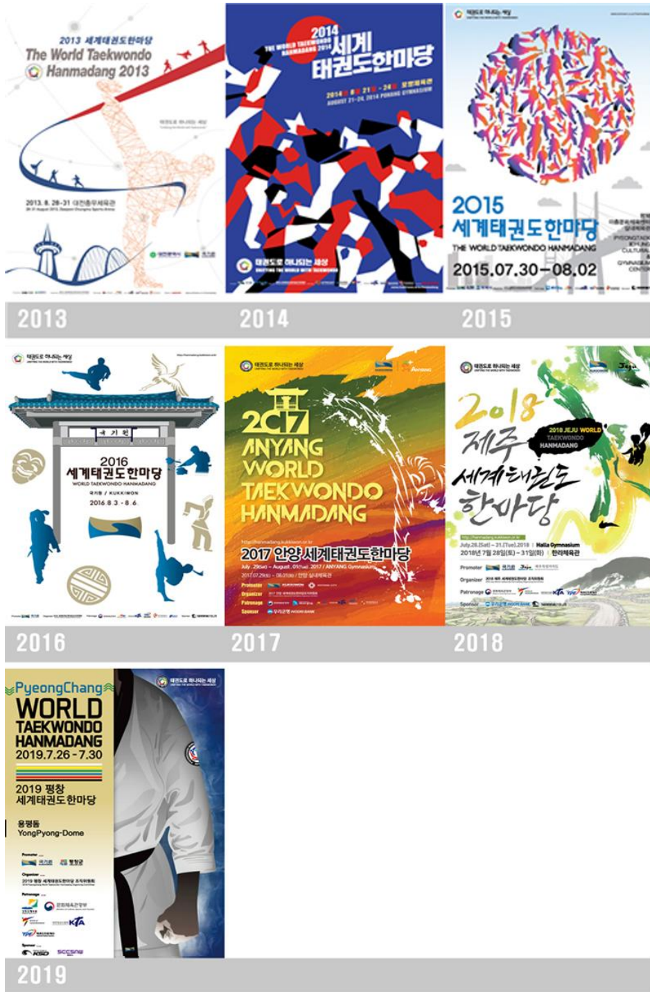
그림 3. 태권도 한마당 포스터 2