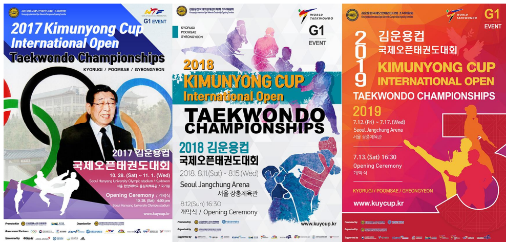
그림 7. 김운용컵 국제오픈 태권도대회 포스터

태권도를 담당하는 총본부로 국기원을 건립, 세계태권도 연맹을 창설했으며, 태권도를 세계화하는데 공로를 크게 기여한 김운용의 뜻을 기념하며, 스포츠의 외교 기를 마련하는 목적으로 김운용컵 국제오픈태권도대회가 주최되었다(김운용컵 국제오픈태권도대회, 2021).