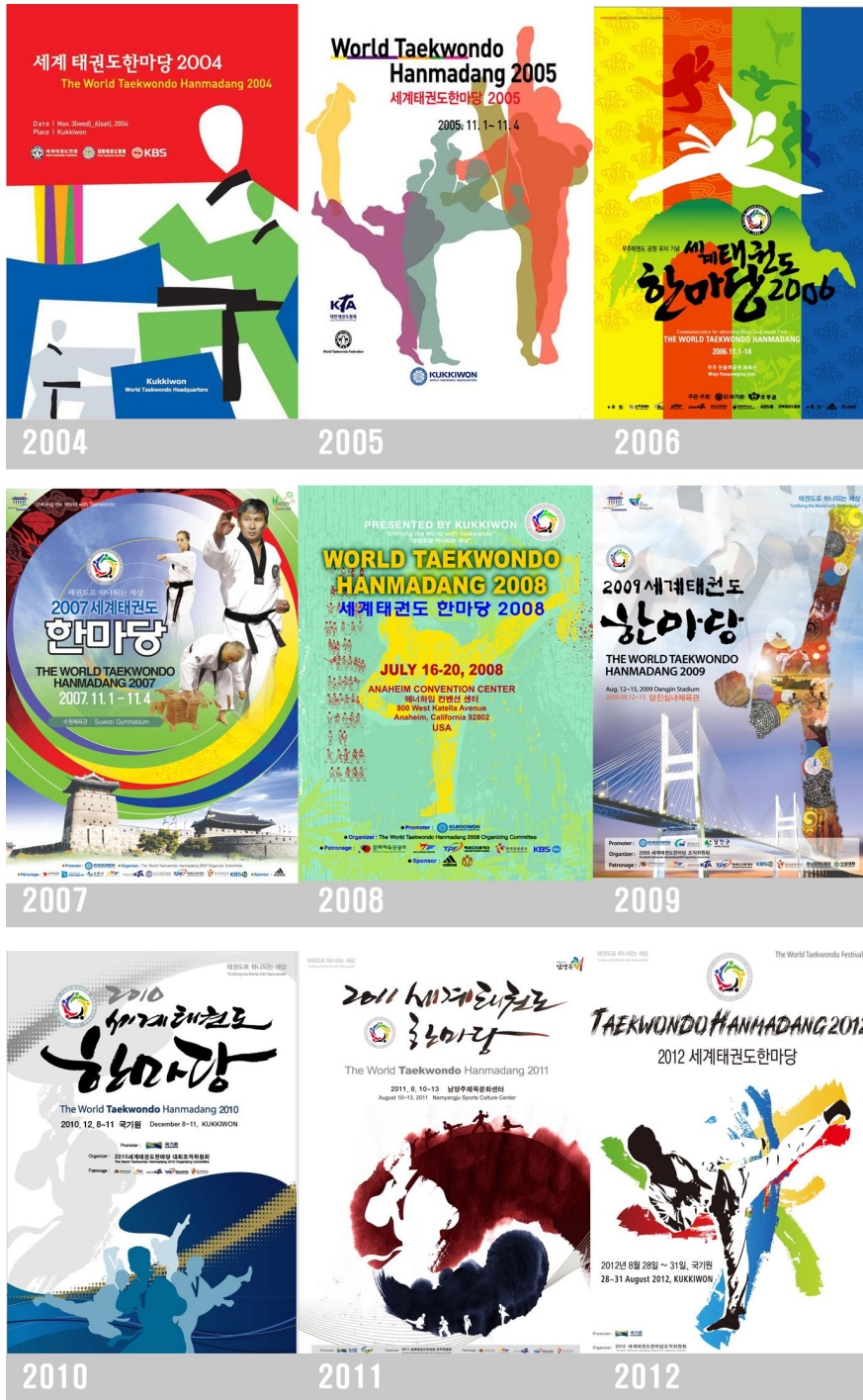
그림 2. 태권도 한마당 포스터 1