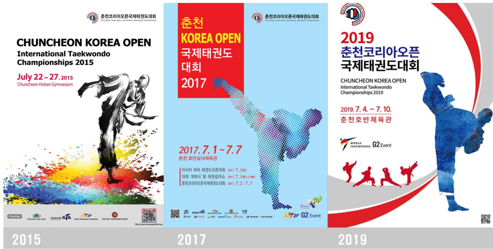
그림 5. 춘천 코리아오픈 국제태권도대회 포스터 2

제1회 춘천코리아오픈 국제태권도 대회는 2000년 5월 24일부터 6월 1일까지 진행되었다. 강원도 춘천 호반체육관에서 겨루기, 경연, 띠별겨루기 3종목으로, 48개국의 1,400명이 참가하였다. 제2회 춘천코리아오픈 국제태권도 대회는 2001년 5월 27일부터 6월 2일까지 진행되었으며, 춘천시와 대한태권도협회가 주최, 춘천코리아오픈 국제태권도대회 조직위원회와 강원도태권도협회와 주관하였다. 총 54개국 1,600명이 참가한 대회였다. 제3회 대회는 2002년 8월 14일부터 8월 19일까지 진행되었으며, 같은 장소인 강원도 춘천시 호반체육관에서 겨루기, 경연, 띠별겨루기 종목으로 56개국의 1,700명이 참가하였다. 제4회 대회는 2003년 10월 4일부터 10월 7일까지였으며, 42개국 1,200명이 참가하였다. 제5회는 2005년 6월 26일부터 7월 1일까지, 51개국의 1,600명이 참가하였고, 명칭을 코리아오픈에서 춘천오픈대회로 변경하였다. 제6회는 2007년 6월 29일부터 7월 4일까지 진행되었고, 46개국 2,200명이 참가하였다. 제6회 춘천오픈 국제태권도대회는 2009년 7월 10일부터 7월 15일까지 6일간 진행되었으며, 45개국의 2,400명이 참가하였다. 제7회 춘천오픈 국제태권도대회는 2011년 7월 14일부터 7월 19일까지 겨루기, 경연, 띠별 겨루기 3종목이 이루어졌고,