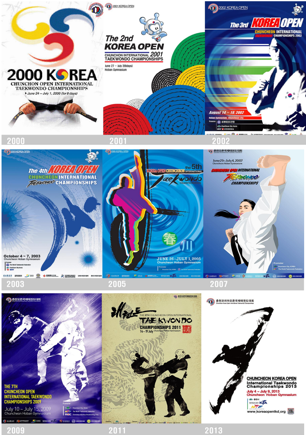
그림 4. 춘천 코리아오픈 국제태권도대회 포스터 1