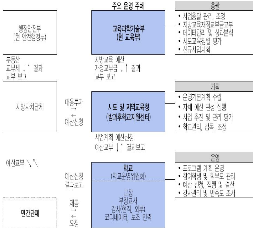
그림 2. 방과후학교의 운영체제

더불어 인근학교와 지역사회의 시설 등으로 교육 장소가 확대되었고, 수요자 즉 학부모와 학생의 의견 수렴과 요구를 최대한 반영하여 탄력 있게 운영하고 있다. 방과후학교의 운영은 학교운영위원회 심의를 거쳐 학교장 중심 운영 또는 위탁운영으로 절차별로 이루어지고 있으며, 방과후학교의 운영체제를 나타내면 다음의 [그림 2]와 같다.