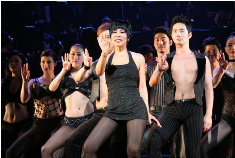
<사진2> 손을 사용한 독특한 동작 1.