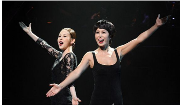
<사진 22> 록시와 벨마의 클라이막스 동작과 포즈 2.