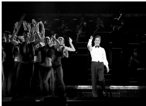
<사진 31> 코러스들의 선정적인 의상과 지팡이 소품을 사용하는 장면