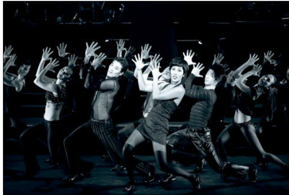
<사진 3> 손을 사용한 독특한 동작 2.