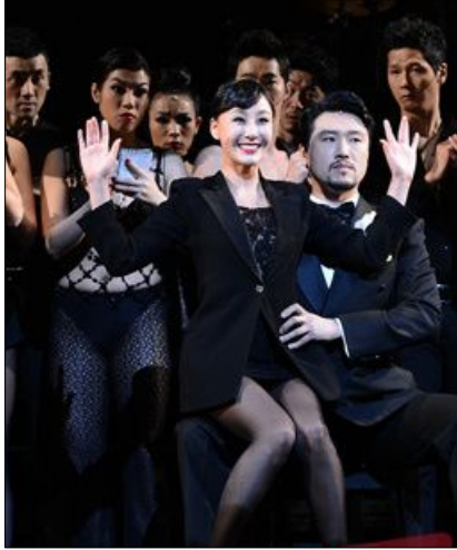
<사진 13> 록시의 마음