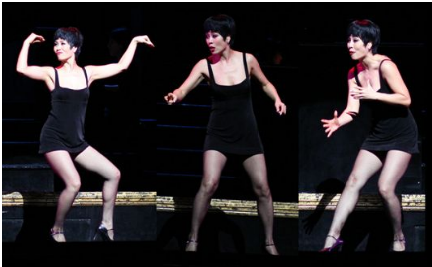
<사진 19> 록시를 설득하는 벨마의 춤 동작

록시의 이야기는 화제가 되면서 벨마의 이야기들은 사람들의 기억 속에서 잊혀질 위기에 처한다. 벨마에게 있어 그녀의 유명세는 물론, 변호사 빌리까지 빼앗아간 록시 하트는 눈에 가시 같은 존재이다. 그러나 벨마 켈리는 록시 하트를 설득하여 동맹을 맺으려 시도한다. 여기서 벨마의 춤은 다양한 춤의 볼거리가 제공하는데, 다리를 점점 높이 차는 동작과 같은 발레를 기초로 한 테크닉과 웨이브와 덤블링과 같은 고난이도의 유연성이 돋보이는 기교가 넘치는 동작들로 섹시하면서도 코믹한 장면을 보여준다. 빠르고 경쾌한 리듬으로 긴장감과 에너지의 상승을 드러내는 움직임은 전체적인 안무에 역동적이고ダイナミック한 이미지를 더한다. 이러한 동작들은 극중 시큰둥한 록시와는 달리 모두가 벨마의 춤에 집중하게 만든다.