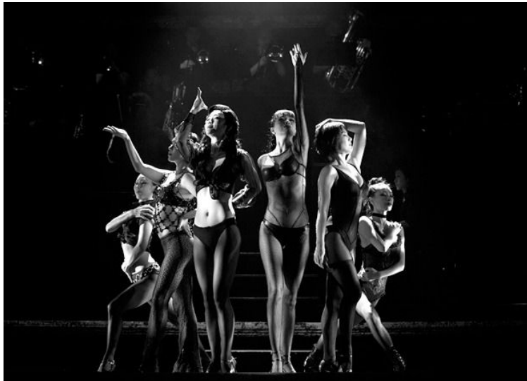
<사진 8> 여섯 개의 의자에서 관능적인 동작과 포즈를 하는 여죄수들

여죄수 여섯 명의 노래, ‘셀 블록 탱고(Cell Block Tango)’ 속 배우들은 모두 자신만의 스토리를 몸으로 표현한다. 파워풀한 재즈댄스 동작 하나하나로 자신의 사연을 표현하는 배우들의 춤을 통해 관객들은 노래를 듣지 않고도 그들의 삶을 이해하게 된다. 여기서 언어는 문제가 되지 않는다.