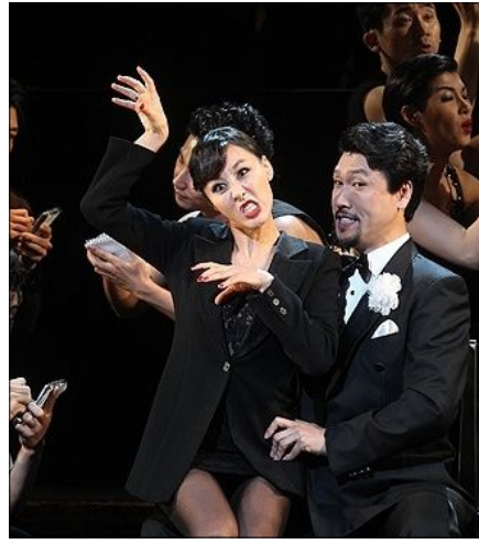
<사진 14> 록시의 익살스러운 표정연기