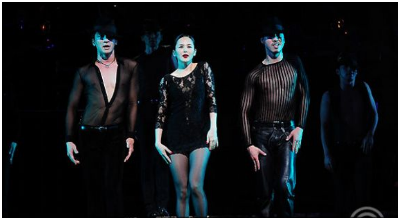
<사진 16> 섹시한 남자 코러스들과 록시의 어깨를 이용한 움직임 장면