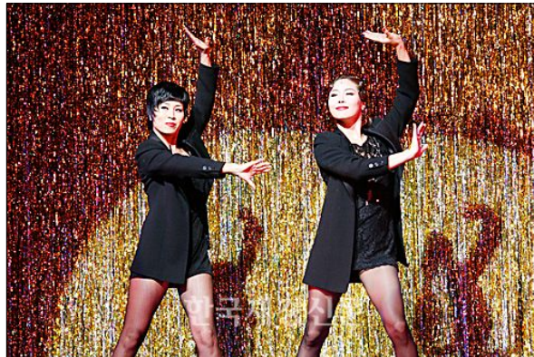
<사진 33> 벨마와 록시의 절도있고 에너지 넘치는 듀엣 춤

‘Nowadays’ 에서 두 여자 주인공의 합동 무대가 스윙풍의 신나는 리듬에 이어지면서 ‘Hot Honey Rag’가 시작된다. 여기서 앞서 함께 했던 두 사람의 조화로운 동작은 경쾌해진 음악에 맞게 동적이면서 유연함을 자랑하는 에너지 있는 동작들과, 굉장히 절도 있고 세련된 동작들로 구성되어 있다. 목이나 어깨를 흔드는 동작이나 손목을 꺾거나, 무릎을 굽혔다 펴는 등 손과 발을 이용한 동작들이 코믹스럽게 안무되어 극의 분위기를 바꾸고, 점점 빨라진 박자에 맞게 빠르고 정확한 스텝과 좀 더 커지고 유연해진 팔 동작과 같은 움직임들은 이 작품의 클라이막스 장면인 만큼 안무가 밥 포시의 특유의 동작과 안무 스타일이 두드러지게 나타남을 알 수 있다.