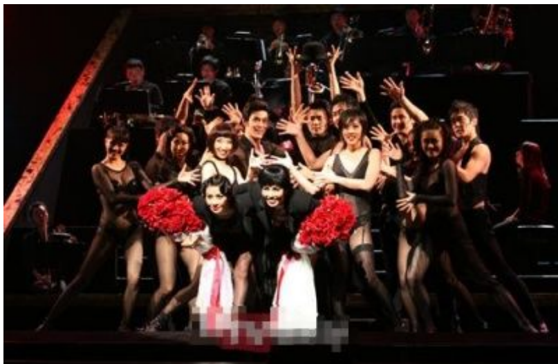
<사진 39> 전 출연진이 동참한 피날레의 멋진 안무가 끝나고 마지막 포즈와 두 여자 주인공의 관객들을 향한 인사 장면 2.