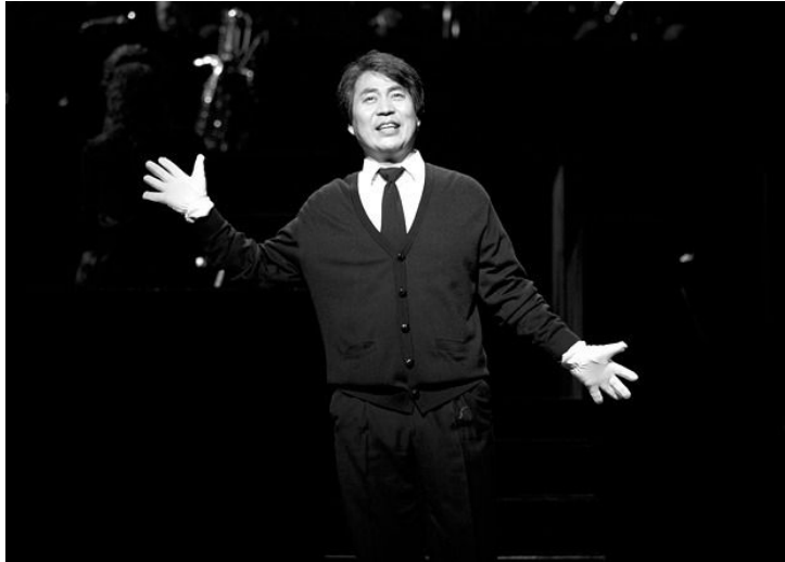
<사진 27> 흰 장갑을 착용하여 양손을 이용한 마임

특히 일관된 우울한 표정으로 정면을 응시하면서 옆으로 걸어가듯 움직이는 마임동작과 하얀 장갑을 이용한 마임, 제스처가 이장면의 특징이다.