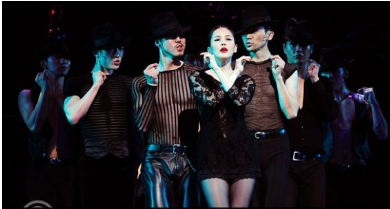
<사진 15> 섹시한 남자 코러스들과 록시의 손가락 튕기기 장면