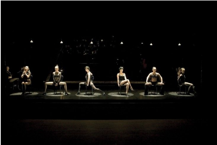
<사진 9> 조명 아래 여죄수들의 관능적인 동작과 포즈