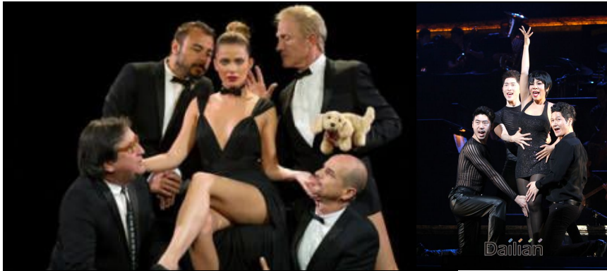
<사진 28> 벨마의 의자를 이용한 섹시하고 관능적인 움직임 표현