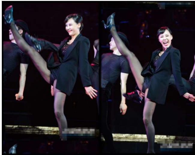
<사진 25> 록시의 '킥'을 차는 고난이도의 테크닉 동작