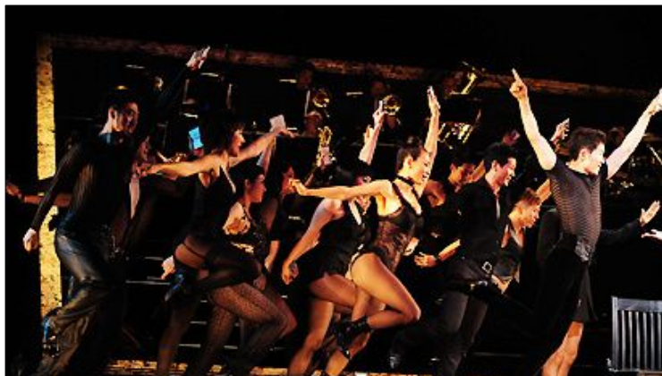
<사진 37> 탄탄한 춤 실력을 자랑하는 코러스들의 다양한 종류의 움직임 표현 2.