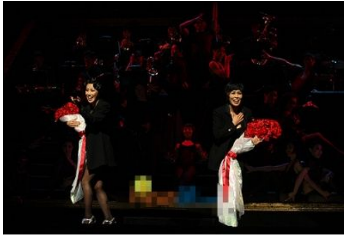
<사진 38> 전 출연진이 동참한 피날레의 멋진 안무가 끝나고 마지막 포즈와 두 여자 주인공의 관객들을 향한 인사 장면 1.