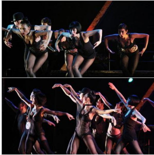
<사진 36> 탄탄한 춤 실력을 자랑하는 코러스들의 다양한 종류의 움직임 표현 1.