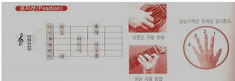
<그림-5> 기타 포지션(Position) 23)

올바른 기타 연주 주법은 왼손가락으로 음 또는 코드를 짚으며, 이 때 손목은 안쪽으로 굽히고 왼손가락은 지판과 수직이 되도록 세워 손끝으로 줄을 누른다.