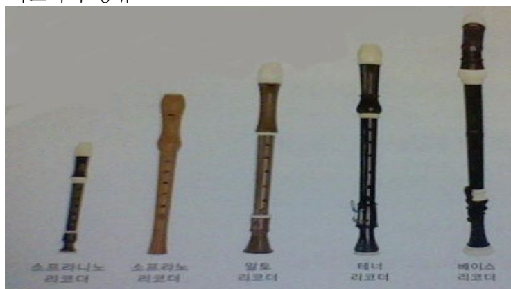
<그림 -1> 리코더의 종류

리코더는 크기에 따라 여러 가지 종류가 있다. 크게 소프라니노, 소프라노, 알토, 테너, 베이스 리코더 등이 있으며, 음역과 음색의 차이가 있다. 많은 리코더를 잘 조합하여 아름다운 합주를 만들 수 있으며, 독주로 잘 쓰이는 리코더는 알토 리코더와 소프라노 리코더이다. 주로 교재에 나오는 리코더는 소프라노 리코더이다.