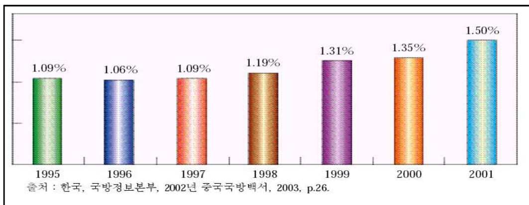
<표4-1> '95 ~ '01년 GDP대비 중국 국방비

국가경제가 지속 성장하고 있는 기반 위에 중국의 국방예산도 나름대로의 증가가 있었다. 연간 중국 국방예산이 국내 총 생산비(GDP)의 비율은 1995년 1.09%, 2001년은 1.50 %였다. 그러나 중국 국방예산의 증가는 항상 비교적 낮은 폭을 유지하고 있으며, 보상 성격의 증가가 주축이다. 1979년에서 2001년 기간 국방예산의 대국가 총예산 지출 점유율은 전반적으로 하강추세를 나타내고 있는 바, 1979년 17.37%, 2001년 7.65 %로 2001년과 1979년을 대비시 약 10% 포인트 하강 한 셈이다. (표 4-1 참고)